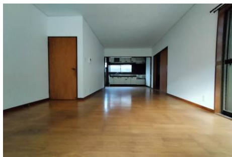
志井小・志徳中校区